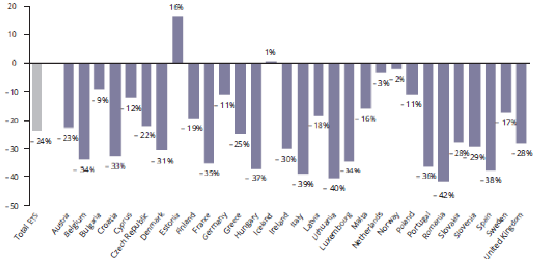
Change in ETS emissions (%)